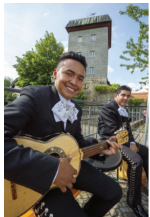
Impressionen vom 22. Sachsen-Anhalt-Tag 2019 in Quedlinburg