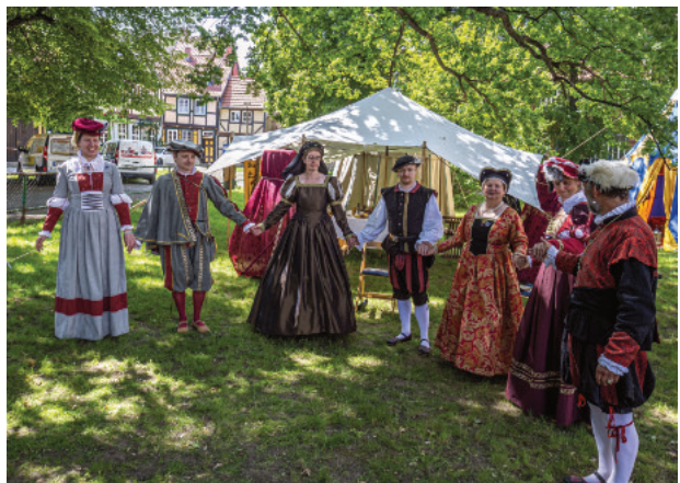
Impressionen vom 22. Sachsen-Anhalt-Tag 2019 in Quedlinburg