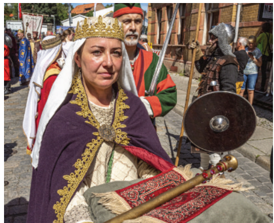
Impressionen vom 22. Sachsen-Anhalt-Tag 2019 in Quedlinburg